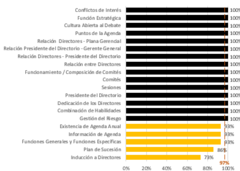
Gráfico Nº 2: Evaluación del Directorio - Resultados por elemento 1